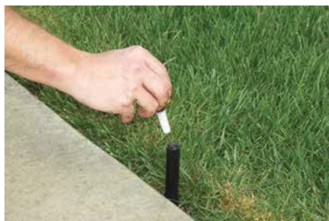
Az 570Z XF lehetővé teszi a fúvókák szárazon történő telepítését és cseréjét