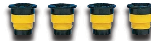
570Z Sugaras esőztető fűvőkák